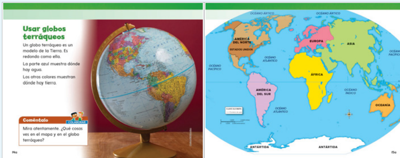
MATERIAL COMPLEMENTARIO, págs. 14a–15a

Have children work in pairs or small groups to discuss the Coméntalo questions from p. 14a. (Children may say that maps and globes show countries, continents, and oceans. They might mention additional landforms.)